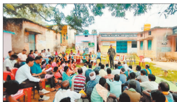
फसल मुआवजा लेने पहुंचे किसान।

छत्तीसगढ़ शासन ने खरीफ 2025 सीजन के लिए प्रधानमंत्री फसल बीमा योजना के तहत अधिसूचना जारी कर दी है। इस योजना के अंतर्गत बीमा कराने की अंतिम तिथि 31 जुलाई 2025 निर्धारित की गई है। यह योजना किसानों को प्राकृतिक आवादों असमय वर्षा, सूखा, ओलावृष्टि, कीट प्रकोप और अन्य जोखिमों से फसल को होने वाली क्षति के विरुद्ध आर्थिक सुरक्षा प्रदान करती है। योजना का उद्देश्य किसानों की आय को स्थिरता प्रदान करना और खेती को एक सुरक्षित व लाभकारी व्यवसाय बनाना है। कृषि विभाग के उप संचालक ने जानकारी देते हुए बताया कि खरीफ सीजन 2024 में जिले के 701 किसानों को प्रधानमंत्री फसल बीमा