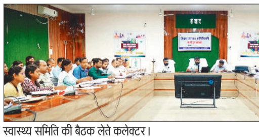
स्वास्थ्य समिति की बैठक लेते कलेक्टर।

उन्होंने मनोरा एवं पंडरापाट विकासखंडों में पहुंचे विहीन क्षेत्रों के लिए बाइक एम्बुलेंस को क्रियाशील कर संचालित करने के निर्देश दिए। वर्षा ऋतु के दौरान मौसमी बीमारियों के