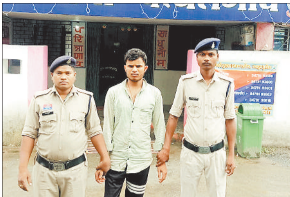
पुलिस गिरफ्त में चोरी का आरोपी।

जिले में बुधवार की शाम पुलिस के लिए चुनौती और कामयाबी दोनों लेकर आई। एक तरफ पथलगांव थाना क्षेत्र के लुडेग गांव में मंदिर की दान पेटी तोड़कर चोरी की वारदात को अंजाम दिया गया, तो वहीं दूसरी तरफ कुनकुरी थाना क्षेत्र में एक अघेड़ व्यक्ति 8 लीटर अवैध महुआ शराब लेकर बाजार में बेचने निकल पड़ा। दोनों मामलों में पुलिस ने त्वरित कार्रवाई करते हुए आरोपियों को धर दबोचा और जेल भेज दिया।